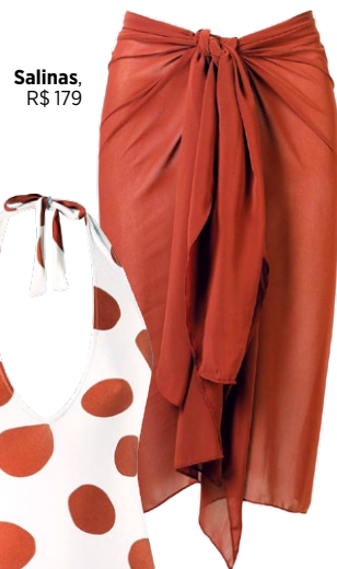
Salinas, R$ 179