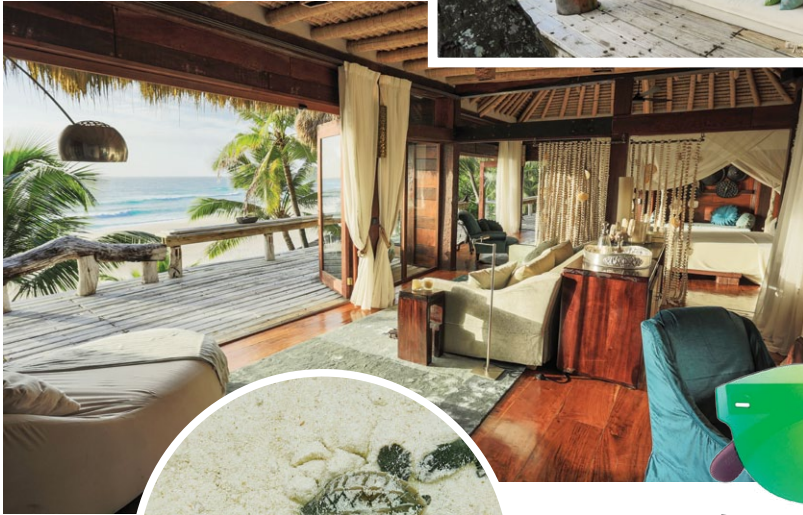
RÚSTICO CHIC Em sentido horário, a partir da foto à esq., uma das villas do resort; passeio de caiaque; e varanda do restaurante The Piazza