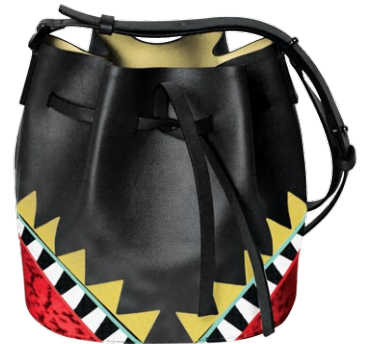
Les Petits Joueurs

ONDE COMER Experimente os pastéis patties, o prato típico Ackee and Salt Fish (feito com bacalhau e a fruta nacional), os bolinhos de chuva salgados festivals e as carnes com molho Jerk, bem apimentado. Na listinha de restaurantes, Miss T's (jamaicano), Houseboat Grill (francês, ótimas lagostas) e Evita's (italiano/jamaicano). :: missskitchen.com :: thehouseboatgrill.com :: evitasjamaica.com