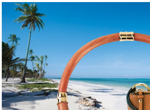
EXÓTICA À esq., Bwejuu Beach, a praia do Baraza Resort & Spa, à beira do Índico