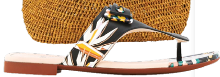
Fendi, R$ 3.470