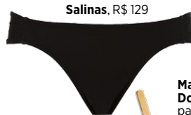
Salinas, R$ 129