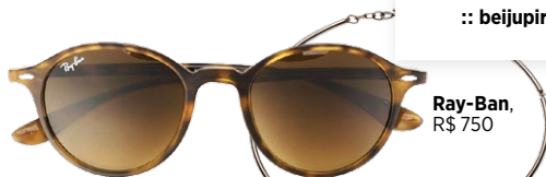
Ray-Ban, R$ 750