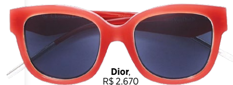
Dior, R$ 2.670