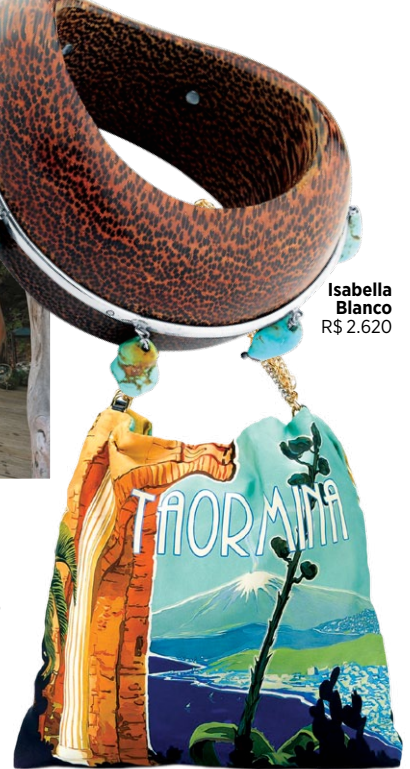
Isabella Blanco R$ 2.620