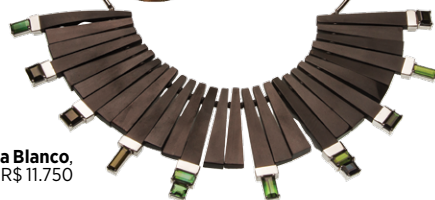
Isabella Blanco, R$ 11.750