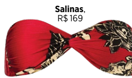
Salinas, R$ 169