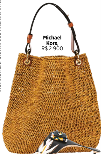
Michael Kors, R$ 2.900

ONDE COMER Vale a pena provar o bolinho de tubarão, feito com carne de tubarão, no Museu do Tubarão. O restaurante da Pousada Beijupirá é delicioso (caipiroskas maravilhosas) e o Mergulhão, de cozinha brasileira contemporânea, tem vista de tirar o fôlego para a Baía de Santo Antonio. :: beijupiralodgenoronha.com.br :: mergulhaonoronha.com.br