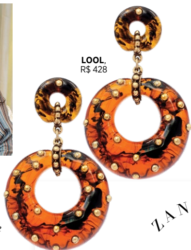
LOOL, R$ 428

Luiza Setúbal, da multimarcas de acessórios LOOL