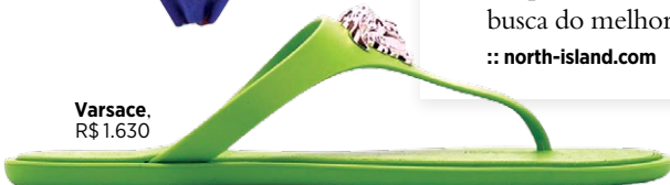
Varsace. R$ 1.630