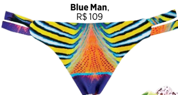
Blue Man. R$ 109